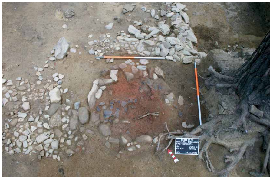
Abb. 2: Runde Herdstelle mit Keramiklage im westlichen Gebäude.

Seit 2007 fanden mehrere Grabungskampagnen am Faltikögerl statt, die sich aus Kostengründen auf den oben erwähnten größeren Hügel und dessen unmittelbares Umfeld beschränkten. Zum gegenwärtigen Forschungszeitpunkt lassen sich drei Bau- bzw. Siedlungsphasen der jüngeren Urnenfelderzeit (zirka 950 bis 800 v. Chr.) unterscheiden. Die Befunde der zwei