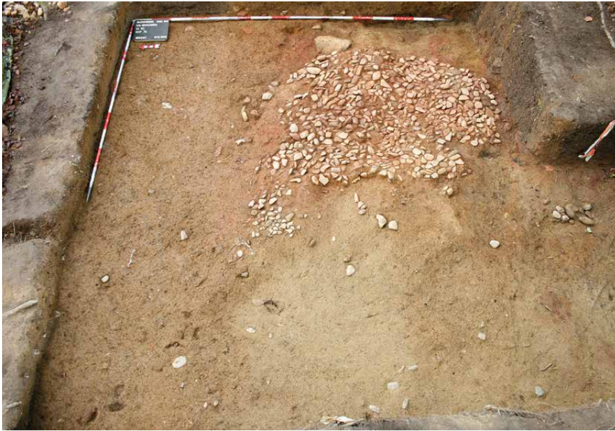
Abb. 3: Gebäude in Schnitt 3, Rest eines aus kleinen Flussgeschieben sorgfältig verlegten Fußbodens.

außerhalb liegende Herdstelle mit vergleichbarem Aufbau zuzurechnen. Ein zweites, noch nicht gänzlich ergrabenes Haus konnte etwas weiter östlich im Schnitt S3 aufgedeckt werden. Dichte Hüttenlehmungen machen ein Gebäude in Ständerbauweise – Flechtwerk mit Lehmverputz – wahrscheinlich, das in seinem östlichen Bereich zudem einen aufwändig verlegten, mindestens einmal erneuerten Fußboden mit Lehmestrich mit den Ausmaßen von zirka 1,80 x 1,40 m besaß (Abb. 3). Zahlreiche hier aufgefundene Webstuhlgewichte sprechen für einen textilhandwerklich genutzten Bereich.